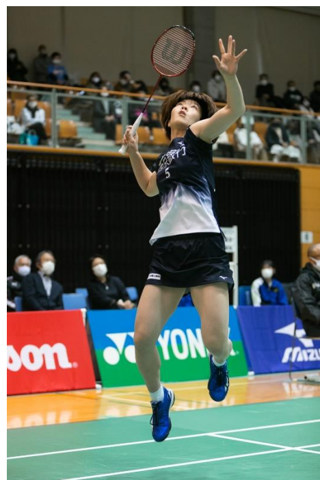
ダイナミックなプレーで大活躍！