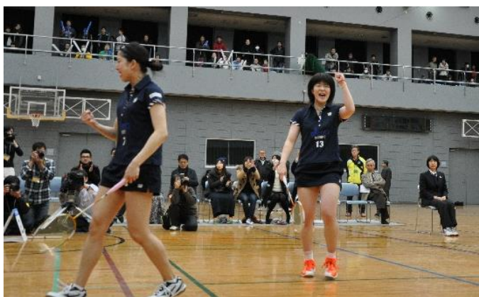
1部リーグ昇格の立役者！